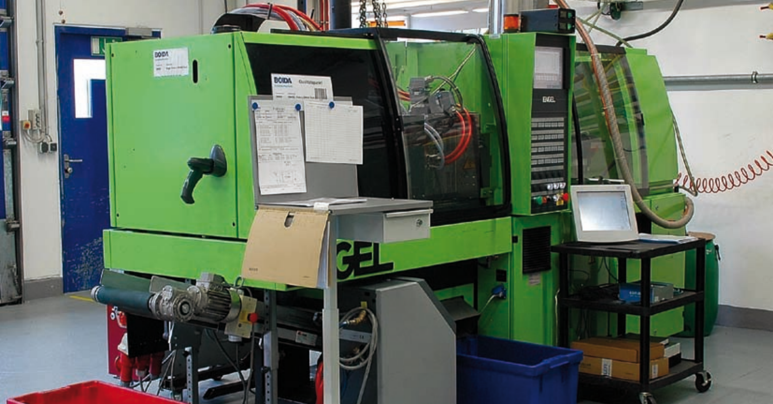
Bild oben: Fertigungszelle Engel Victory 200/45 Tech bei Boida in St. Ulrich am Pillersee.