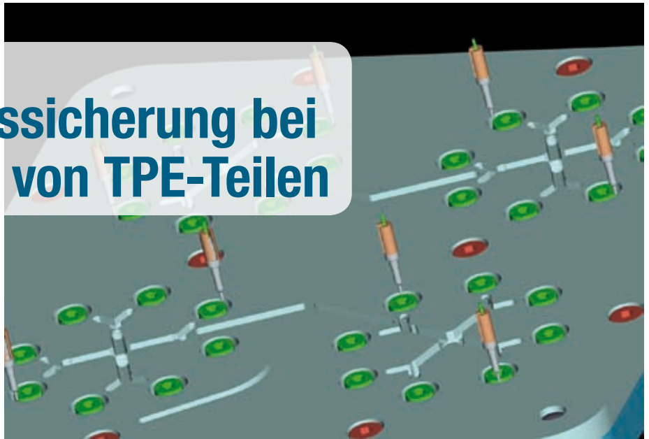
Selektive Verteilung der Drucksensoren an den Kavitäten des Werkzeugs.

In der Praxis stellen die Viskosität und Elastizität von TPE die Verarbeiter prozessual vor einige Hürden. Das gilt insbesondere bei Chargenwechsel. Hinzu kommt – gerade bei Mehrkavitätenwerkzeugen ist der Prozess in engen Toleranzen oft eher ein stetiges Anpassen an die Maschine, ohne das Füllverhalten der Kavitäten wirklich zu beherrschen.